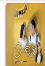
《一年之後》 網路竊賭