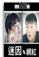
《迷因x網紅》 網路霸凌、 網路展演/直播、 個資隱私