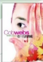
《看不見的時候》 網路交友的陷阱