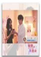
《網美照過來》 網路性剝削、 網路騷擾、展演