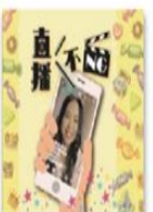
《直播NG》 網路直播現象