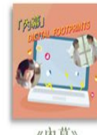
《內幕》 數位跟蹤、數位足 跡、直播、個資隱私