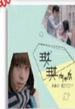
《琪琪出任務》 網路霸凌