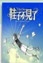
《鞋子不見了》 網路遊戲成癮及 親子衝突解套