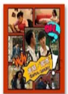
《虛擬/實境》 網路霸凌、 網路成癮、詐欺