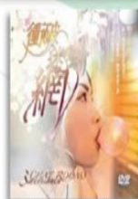
《衝破迷網》 網路援交少女 心路歷程紀錄片