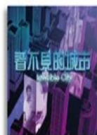
《看不見的城市》 網路霸凌