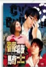
《薔薇騎士》 網路霸凌