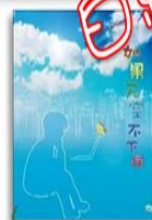
《如果天空不下雨》 網路性侵及 性別平等